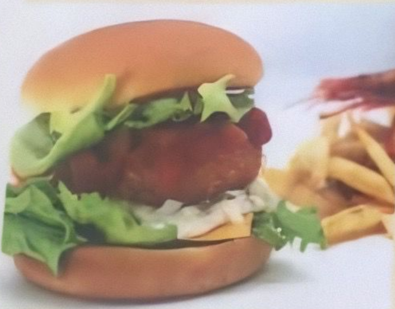
熟成真たらバーガー