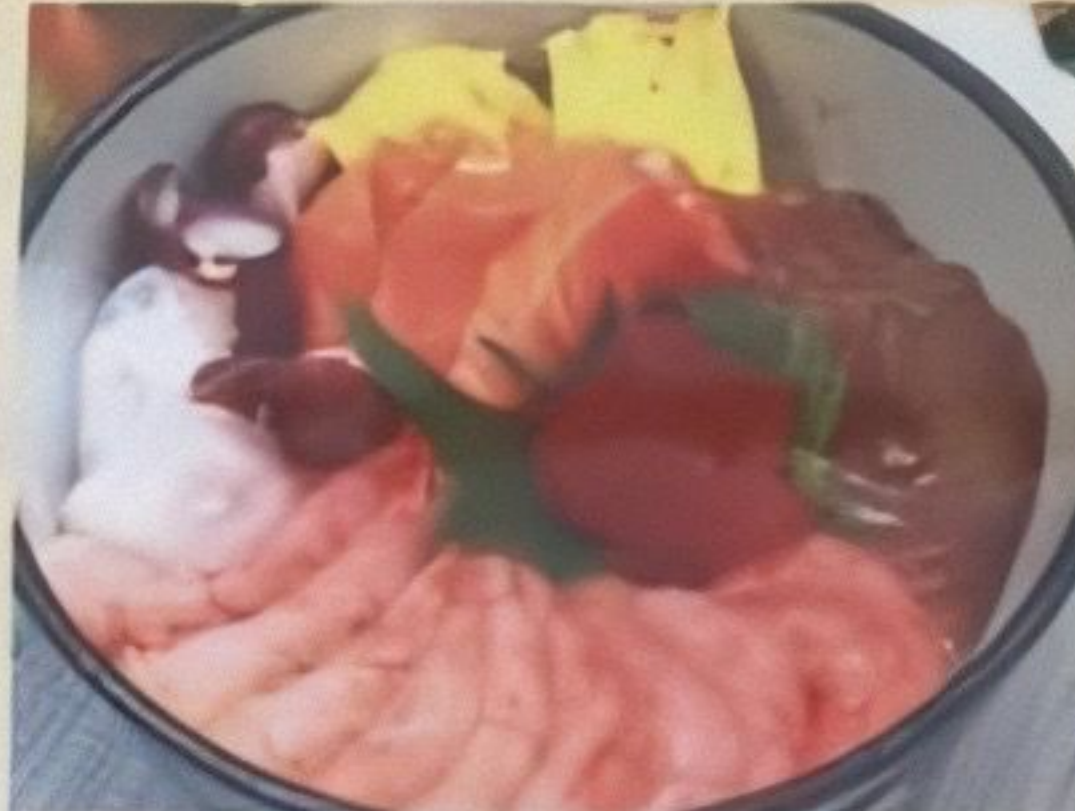
えびがメインの海鮮丼