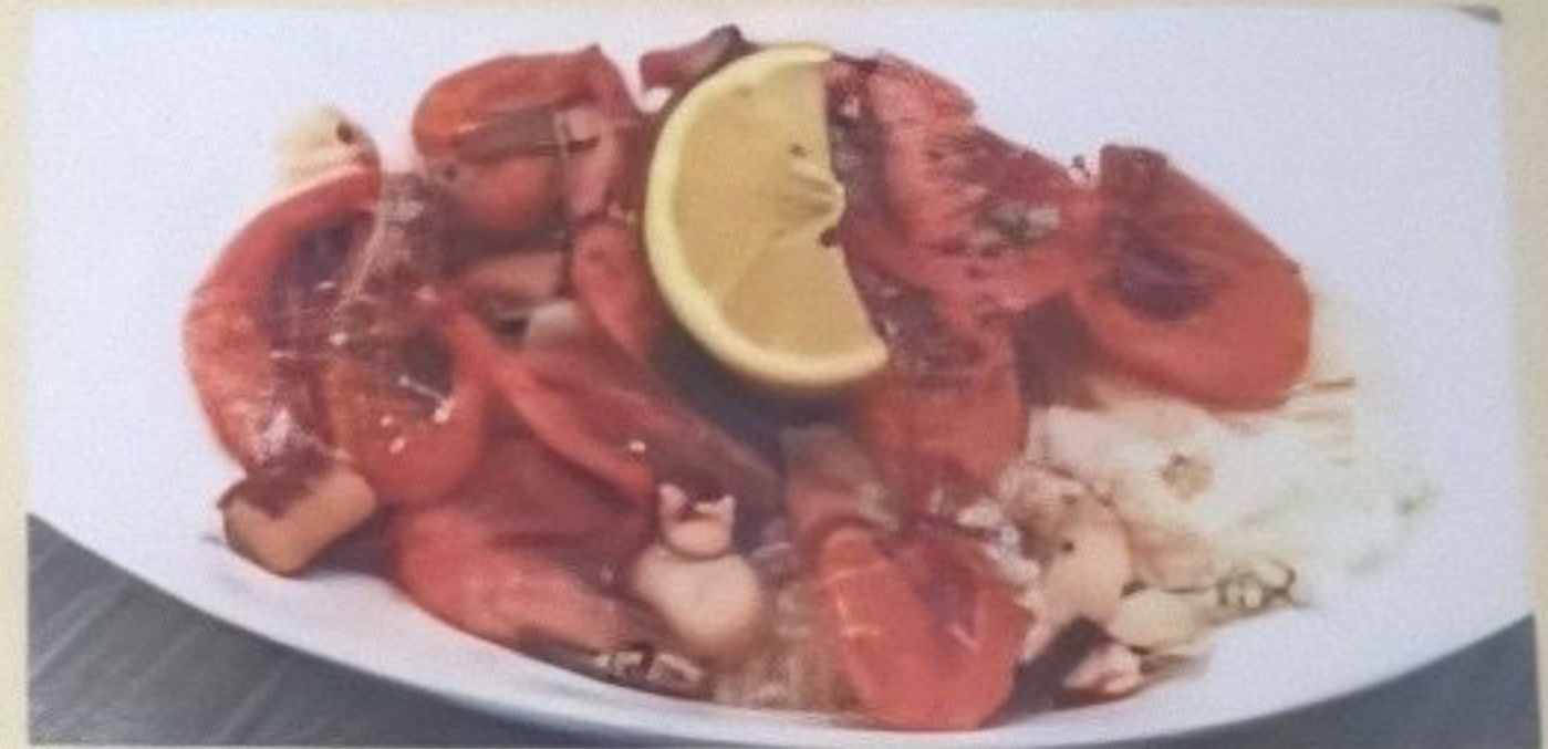
ガーリックシュリンプ