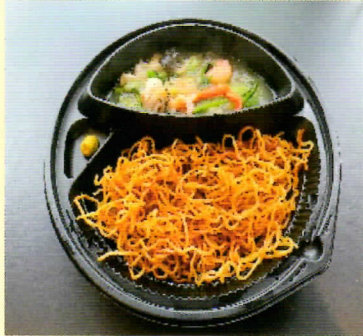
小樽の海鮮 あんかけ焼きそば ¥750