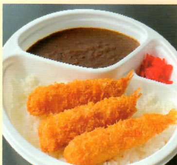
エビフライカレー ¥800