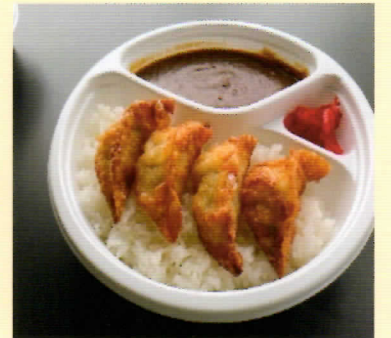
エビタコ餃子カレー ¥800