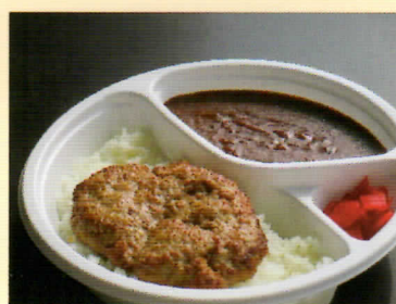
ハンバーグカレー ¥800